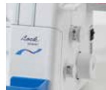
Gemakkelijk toegankelijke bedieningen