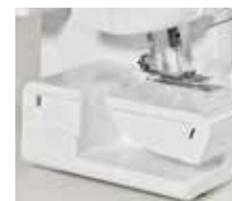
Vrije arm / vlakbed verwisselbaar naaioppervlak