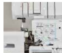
Inrijgschema met 4 kleuren