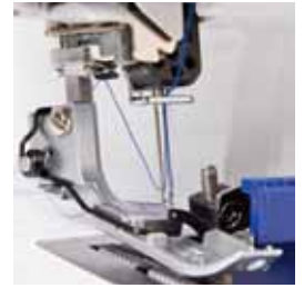
Automatische draadinvoer in de naald